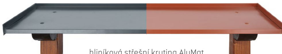
hliníková střešní krytina AluMat